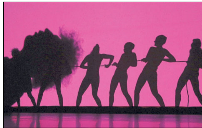
In märchenhafte Fantasiewelten und fremde Kulturen entführte das Ensemble »Die Mobilés« die Zuschauer am Silvesterabend.